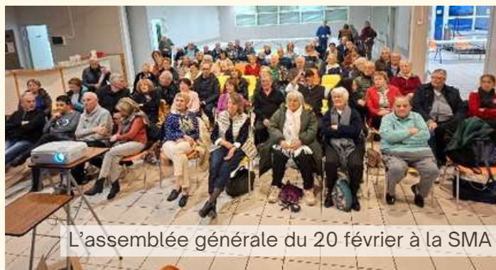
L'assemblée générale du 20 février à la SMA

Depuis Toulon, nous embarquons sur le ferry, direction la Sardaigne pour 5 jours de découvertes et de visites. ”