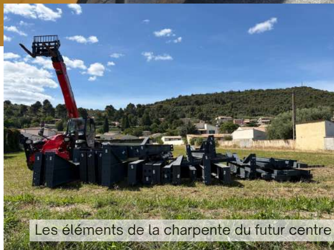
Les éléments de la charpente du futur centre